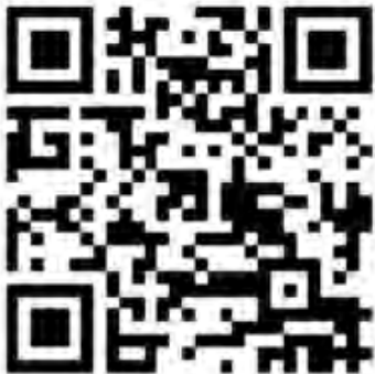
QR - Tilmelding