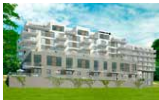
Kongens Ege, Randers