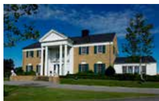
Memphis Mansion, Randers

REEHOLM & BREDAHL A/S arbejder med mange spændende opgaver lige nu. Vi laver boliger, renoveringer, udvider virksomheder, skoler, atletikhal, kunstgræsbaner og er med til at etablere letbanen i Aarhus.